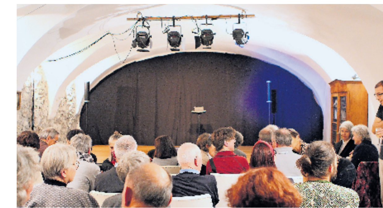
Ils vouts illa chasa a Süzöl 4 a Lavin han dat il nom a «La Vouta».

L'instituziun es üna società classica cun raduond 300 commembras e commembers, impustüt indigens, e chi organisescha e promouva arrandschamaints culturals cun artistas ed artists indigens e d'ütro. La radunanza generala da la società es per regla minch'on d'ütuon. La suprastanza da la società